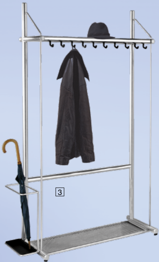
Reihengarderobe topline mit 10 Haken

B 1000 x T 430 x H 1850 mm mit 10 Haken Nr. 6073 Schirmhalter Nr. 6049