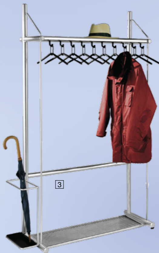
Reihengarderobe topline mit 10 Bügeln

B 1000 x T 430 x H 1850 mm mit 10 Haken Nr. 6073 Schirmhalter Nr. 6049