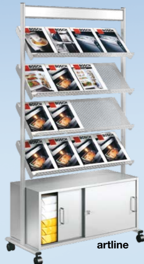
Prospektregal artline 16 x DIN A4 mit Schrank B 930 x T 350 x H 1700 mm Nr. 3489