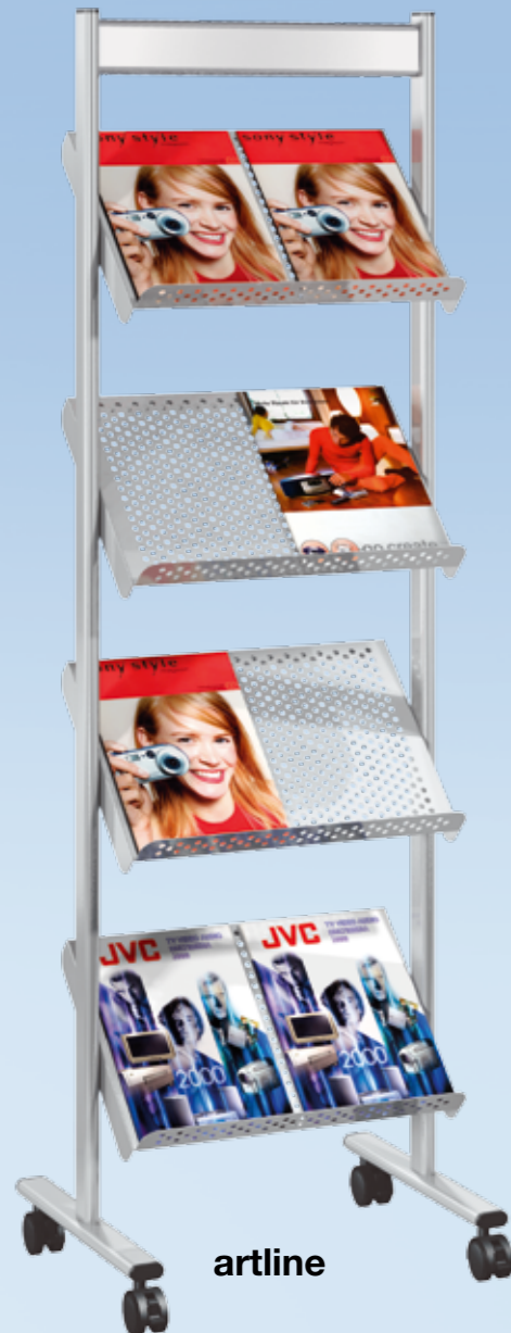
Prospektregal artline 8 x DIN A4 B 530 x T 350 x H 1600 mm Nr. 3481