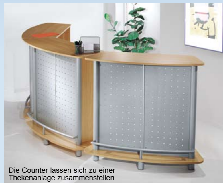
Die Counter lassen sich zu einer Thekenanlage zusammenstellen